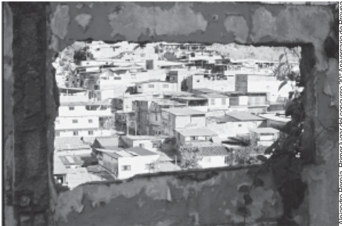
Alejandro Pernia. Primer lugar del concurso 20 o Aniversario de Provea

INFORME ANUAL OCTUBRE 2007 / SEPTIEMBRE 2008