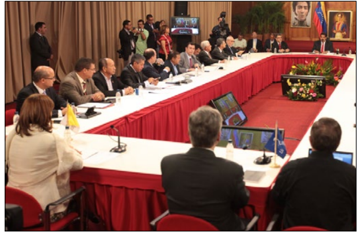
Reunión de diálogo entre el gobierno y la oposición.

Lo que sí queda demostrado es que la paz y los derechos humanos no son un “asunto interno” de los Estados, y que el acompañamiento de otros estados y de organismos multilaterales resulta en nuestros