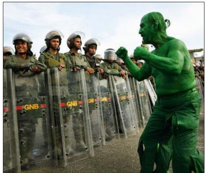
"Hulk" rechaza la represión en San Cristóbal.

¿Cómo se protestaba antes de 1999? –fecha del inicio de la primera presidencia de Hugo Chávez-. La historiadora Margarita López Maya creó durante esos años la base de datos "Bravo Pueblo" para medir los tipos y motivaciones de la protesta en el país. Entre 1985 y 1999 las tres principales formas en que se protestó en Venezuela fueron, en orden de importancia: disturbios, marchas y cierres de vías. Un disturbio es caracterizado como una forma de protesta violenta, debido al enfrentamiento con los cuerpos policiales y la represión de estos sobre los manifestantes. Los cierres de calle no solamente se realizaban con los cuerpos de los partici-